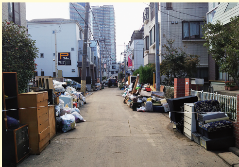
路上に混合状態で堆積した災害廃棄物