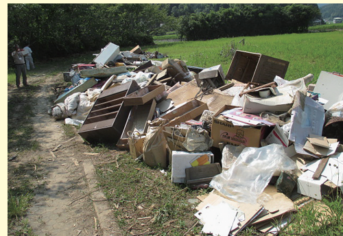
公園等に混合状態で堆積した災害廃棄物