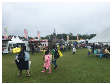
国際農業機械展in帯広「フードバレーとかち食彩祭2018」の様子