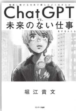
(表紙画像使用許可済)

最近、ニュースなどでよく耳にするChatGPT。生成AIの一つで生活になじみつつあります。ここでよく問題視されるのが、人間の仕事が奪われてしまうのではないかとという点です。